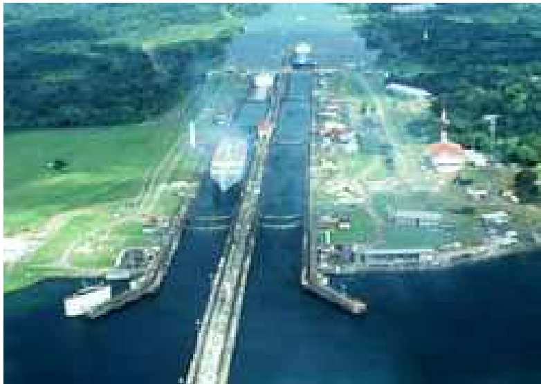
Una de las esclusas del sistema de Gatún

Una vez en el Lago Gatún, el buque navega hacia el oeste, pasando por el Corte de Gaillard, que lleva el nombre del ingeniero francés David DuBose Gaillard, quien dirigió las obras de construcción de ese segmento del Canal. De ahí el buque continúa su ruta hacia las Esclusas de Pedro Miguel y de Miraflores, ambas al extremo Pacífico del Canal. Estos dos sistemas de esclusas descienden hasta llegar al nivel del Océano Pacífico, donde las compuertas se abren para permitir que la embarcación salga por el Puerto de Balboa. En total, una embarcación tarda de 8-10 horas en transitar por el Canal de Panamá.